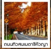
ถนนทิวสนเมตาซึกิวงญา