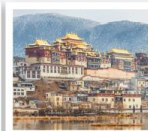
วัดจงจ้านหลิง