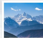
ภูเขาหิมะเหม่ยหลี่