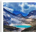
ทะเลสาบน้ำนม