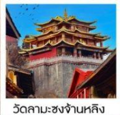
วัดลามะชงจั้นหลิง