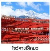
โซ่วจางอีหมว