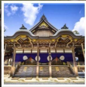
ศาลเจ้าอิเสะ