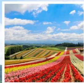
สวนดอกไม้ชิชิโซโนะโอกะ