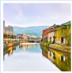
เมืองโอตารุ