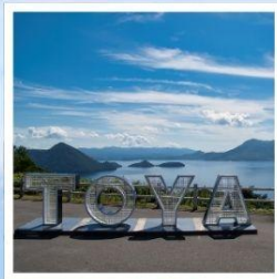
จุดชมวิวจิโง

ชมวิวที่สวยงามที่สุดบนทะเลสาบโทยะ ณ จุดชมวิวจิโง เมืองสุดแสนโรแมนติก กับถนนสายของหวานชื่อดัง โอตารุ ศิลปะบนนาข้าว เรื่องราวในทุ่งนาสะท้อนจิตวิญญาณแห่งฮอกไกโด ที่ 1 ปี มีครั้งเดียว กิน กิน และ กิน จุใจไปกับเมล่อนเย็นฉ่ำแบบไม่อื่น ชมฟาร์มโคนมชื่อดัง นิเซโกะ ทาคาฮาชิ กับวิวโยเทแสนพิเศษ สวนดอกไม้กับวิวเทือกเขาที่โด่งดังที่สุดแห่งฮอกไกโด ณ สวนชิชิโซโนะโอกะ พักออนเซ็น 1 คืน!!! พักในเมืองชิปปุโร 2 คืน เมนูพิเศษ...บุฟเฟ่ต์เมล่อน, บุฟเฟ่ต์ชาปู, บุฟเฟ่ต์ซาบู, บุฟเฟ่ต์ปังย่าง กรุ๊ปสบายๆ เพียง 20 ท่านเท่านั้น!!!