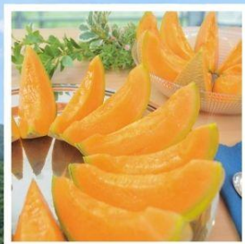
ศูนย์จำหน่ายเมล่อนยูบาริ