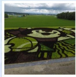
ศิลปะบนนาข้าว