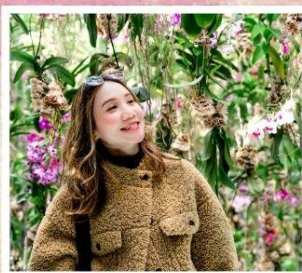
TEAMLAB PLANETS ล่องเรือหุบเขานากาโทโระ