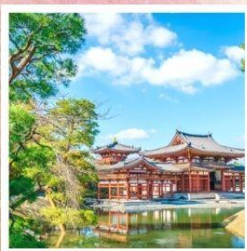
วัดเบียวโดอิน

วัดเบียวโดอิน ชม "วิหารแห่งความงามอมตะ" สัญลักษณ์ที่ถูกจารึกไว้บนเหรียญ 10 เยน ชีราคาวาโกะ หมู่บ้านมรดกโลก บ้านพักโฮสสุริสวายตั้งเทพนิยาย จุดชมวิวกิโยซาโตะ ที่ราบสูงกับทิวทัศน์สุดชิล ท่ามกลางสายลม ขุนเขา และทุ่งหญ้าเปลี่ยนสี ศาลเจ้ามิตสึมิเนะ แดนศักดิ์สิทธิ์บนยอดเขา ศูนย์รวมพลังอันโด่งดังกว่า 1,900 ปี TEAMLAB PLANET ตี๋มดำกับโลกแห่งแสงสีไร้ขีดขอบเขต ความมหัศจรรย์เหนือจินตนาการ ล่องเรือหุบเขานากาโทโระ สัมผัสเสน่ห์เรือไม้ดั้งเดิมผ่านสายน้ำธรรมชาติและวัฒนธรรม พักออนเซ็น 1 คีน!!! // เมนูพิเศษ...บุฟเฟ่ต์ปิ้งย่าง, บุฟเฟ่ต์ชาบู กรู๊ปสบายๆ เพียง 20 ท่านเท่านั้น!!!