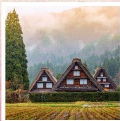
หมู่บ้านชีราคาวาโกะ