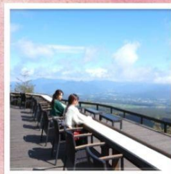
จุดชมวิวกิโยซาโตะ