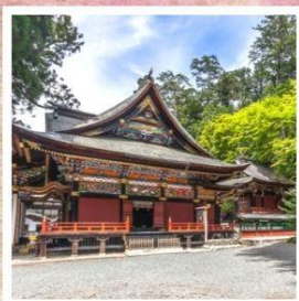
ศาลเจ้ามิตสึมิเนะ