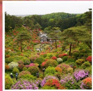
วัดชิโอะฟูเนะ คันนงจิ

โตเกียวดิสนีย์แลนด์ ดินแดนในฝันของคนทั้งโลก ฮานาโมโมะ โนะ ซาโตะ ดอกทิวลิปหลากสีที่รอคุณมาเยือน ทางรถไฟสายเก่า เคอะเกะ อินโคลน์ 1 ในจุดชมซากุระที่สวยงามแห่งเกียวโต ปราสาทอินุยามะ 1 ใน 12 ปราสาทดั้งเดิมกับทิวทัศน์อันแสนสวยงาม ขึ้นกระเช้าที่สูงที่สุดในญี่ปุ่น โคมากะทาเกะ กับแอ่งเทือกเขาสุดอัศจรรย์เช่นโจจิชิ เซอร์ค ชิโอะฟูเนะ คันนงจิ วัดแห่งดอกไม้สุด unseen ที่ไม่ควรพลาด พัคออนเซ็น 2 คับ!!! // อาหารพิเศษ...บุฟเฟ่ต์ปังย่าง, บุฟเฟ่ต์ชาบู, บุฟเฟ่ต์ซาปู กรุ๊ปสบายๆ เพียง 20 ท่านเท่านั้น!!!