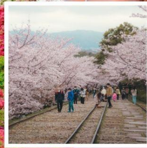
เคอะเกะ อินโคลน์