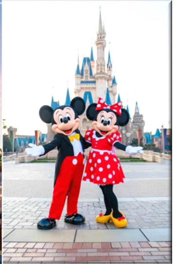
📍 พักที่ TOKYO DOME HOTEL หรือเทียบเท่า

วันที่เจ็ด โตเกียว (นาริตะ) – สิงคโปร์ – สิงคโปร์ – กรุงเทพฯ