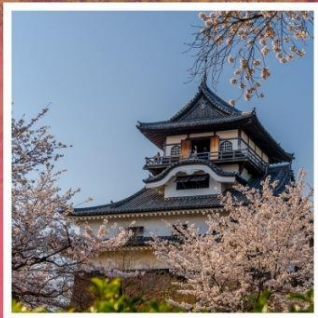
ปราสาทอินุยามะ