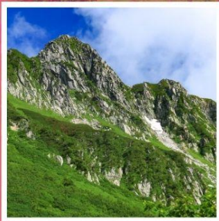
กระเช้าลอยฟ้าโคมากะทาเกะ