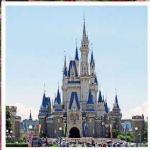
โตเกียว ดิสนีย์แลนด์ สวนฮานาโมโมะ โนะ ซาโตะ