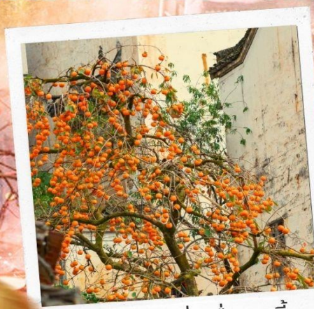
柿柿如意 ชื่อ ชื่อ หยูอี้ ลูกพลับแห่งความราบรื่น