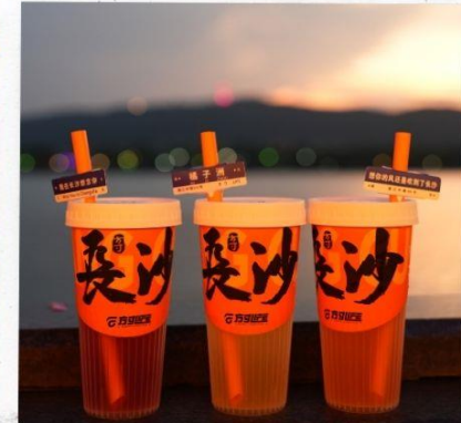
เซียงเจียงริเวอร์ไซด์