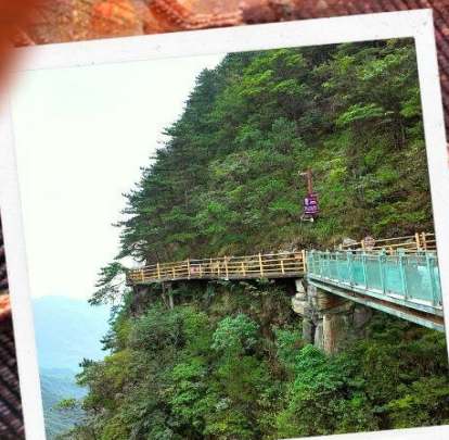
หมิงเยวี่ยซาน