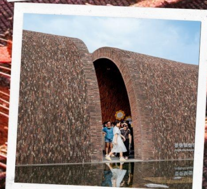
จิ่งเต้อเจิ้น