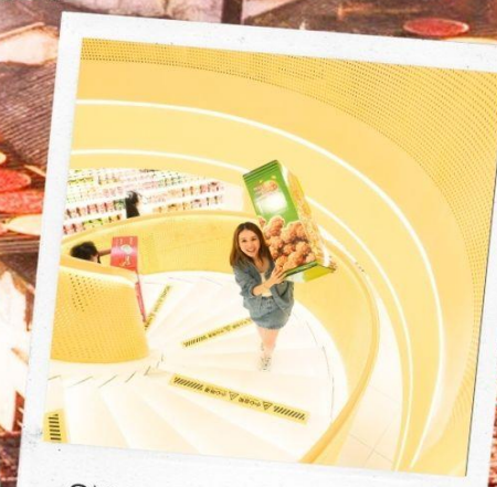
SNACK BUSY STATION