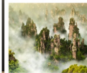
เขาวาดตาร