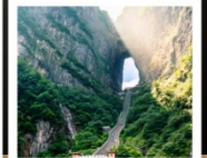
เขาทึบเหมินซาน