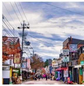
ถนนช้อปปิ้งคารุอิชาว่า