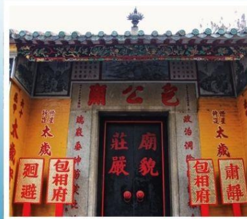
วัดเปากง