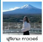
ฟูจิยามะ ทาวเวอร์