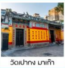
วัดเป่ากง มาเก๊า

ถนนซ็อบบิงคารุอิซาวา / สวนสาธารณะโอโมอิซิดาชิ เมืองคุซัทสึ / นั่งกระเช้าฮาคุบะ อิวาตาเกะ จุดชมวิวฮาคุบะเมทท์เทนฮาร์เบอร์ / คามิโคจิ / สะพานคัปปะ ปราสาทมัตสึโมโตะ / ฟูจิยามะ ทาวเวอร์ / ซ็อบบิงชินจูกุ วัดนาริตะ / อีออน พลาซ่า / วัดอามา / วัดเป่ากง เจ้าแม่กวนอิมปราสาททงริมทะเล / เซนาได้สแควร์ ถนนคนเดินไทปา / เดอะ ลอนดอนเนอร์ / เดอะ เวเนเชียน