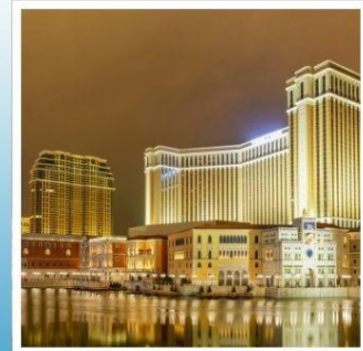
เดอะ เวเนเชียน

ถนนคนเดินสุดชิคไม่เหมือนใคร ณ คารุอิชาว่า กินซ่า สตรีท ฮาคุบะอิวาตาคะ ระเบียงกระจกที่สวยงามที่สุดแห่งฮาคุบะ คามิโคจิ สัมผัสมนต์เสน่ห์สวิตเซอร์แลนด์แดนญี่ปุ่น คุซัทสึออนเซ็น เมืองออนเซ็นอันทรงเสน่ห์ที่ต้องมาเยือน จุดชมวิวแห่งใหม่ในสวนสนุก ฟูจิวอล์คแลนด์ กราบไหว้ขอพรกับเทพเจ้าองค์ไต่ส่วยเอี้ย วัดเปากง สัมผัสความอลังการของ เดอะ เวเนเชียน รีสอร์ทระดับเวิลด์คลาส พักกลางแหล่งช้อปปิ้ง 2 คืน พักออนเซ็น 1 คืน!!! อาหารพิเศษ...บุฟเฟต์ซาบูยักซ์, บุฟเฟต์ซาบู, หม้อไฟโฮโต กรุ๊ปสบายๆ เพียง 25 ท่านเท่านั้น!!!