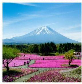
ทุ่งพืชมอส