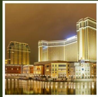
เดอะ เวเนเชียน

ฟูจิยามะ ทาวเวอร์ ขึ้นชมฟูจิจากสวนสนุกที่ไม่เหมือนใคร