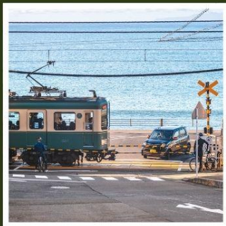
รถไฟเอโนะเด็ง