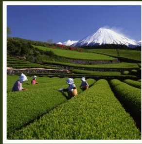
ไร่ชาโอบุจิชะชะบะ