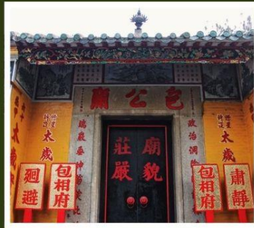
วัดเปากง