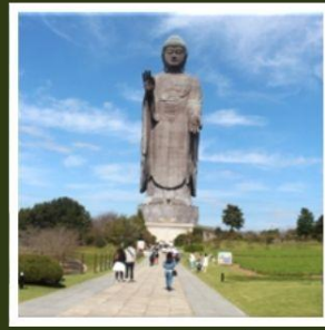
พระพุทธรูปอชิคุไดบุทสึ