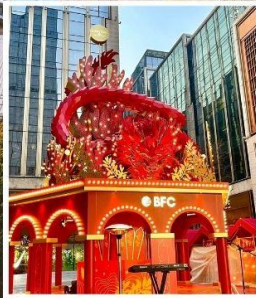
THE BUND WEEKEND MARKET BFC