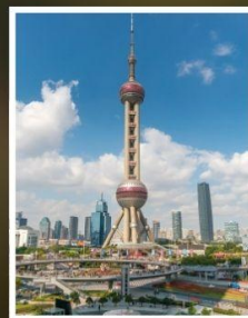
ชั้นหอไข่มุก