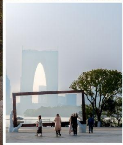
SUZHOU LARGE PHOTO FRAME