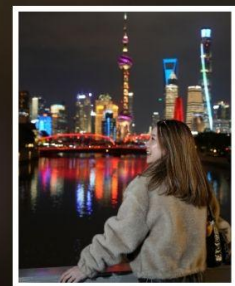
เซี่ยงไฮ้ คลาสสิก ไทท์