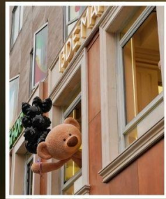
ถนนอันฟู