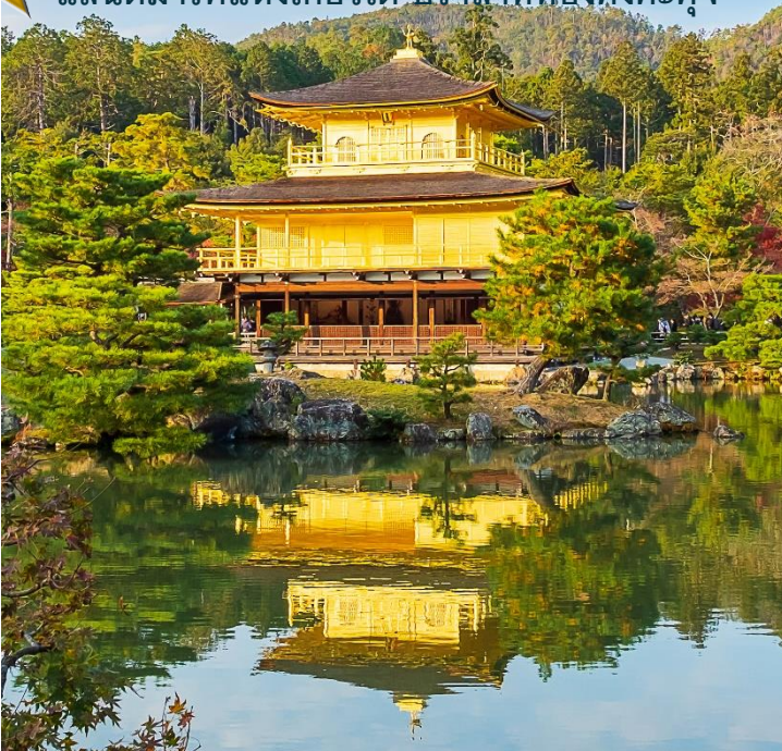
แลนด์มาร์คแห่งเกียวโต ปราสาททองคิงคะคุจิ