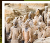
สุสานจีนซี