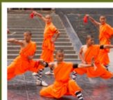
โซ่วเล่าหลิน

กำแพงเมืองโบราณซีอาน / วัดลามะ / ตลาดมุสลิม อุทยานหยุนโกซาน / ศาลเจ้ากวนอู / ถ้ำหินหลงเหมิน วัดเล่าหลิน / ป่าเจดีย์ / โชว์การแสดงวิทยายุทธเล่าหลิน สุสานทหารจีนซี / ถนนคนเดินวัฒนธรรมต้าถิง / โชว์ราชวงศ์ถัง