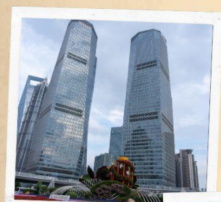
ย่านลู่เจียจู่ย