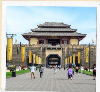
โรงถ่ายภาพยนตร์ ชิงหมิงช่างเหอฉู