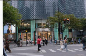
ถนนคนเดินหวยไห่