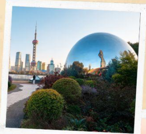
North bund green land