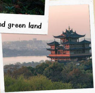
หอเจิ้งหวงเก้อ