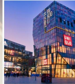
ย่านซานหลี่ถุน