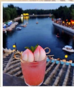
TANG FANG CAFE