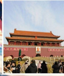
จัตุรัส เทียนอันเหมิน