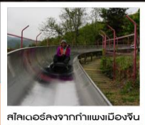
สไลด์เดอร์จากกำแพงเมืองจีน