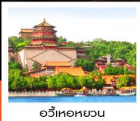
อวิ๋เหอหยวน